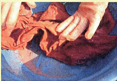
<ベンガラ液に付けています。>